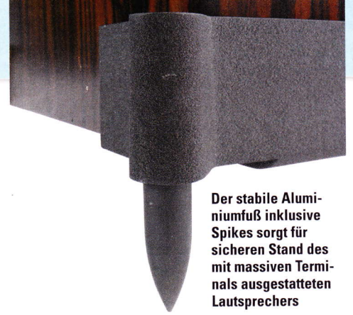
Der stabile Aluminiumfuß inklusive Spikes sorgt für sicheren Stand des mit massiven Terminals ausgestatteten Lautsprechers