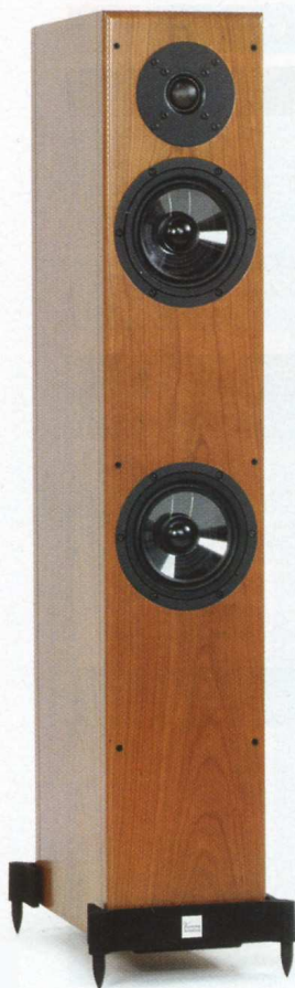
Το σύστημα στήριξης των πχέων της Vienna λέει τη δική του ιστορία.