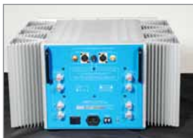
Altro pannello posteriore di riferimento.