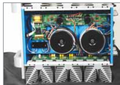
Un finale stereo corazzato, basti dare un'occhiata all'alimentazione, ma dolce e sincero.

mentale: il piacere d'ascolto. Piacere d'ascolto o della facilità con cui si rimane davanti all'impianto per ore e ore, ascoltando musica senza doversi concentrare ora su un parametro ora sull'altro, chiedendosi come si possa migliorare ancora. Il segreto di tutti gli oggetti audio, quale che sia la tecnologia posta alla loro base, credo risieda proprio in questo: la magia, la piacevolezza, la capacità di incantare e convincere con la loro voce. Quei pochi apparecchi che riescono ad abbattere le barriere tra noi e la musica registrata entrano a buon diritto fra quelli che sembrano possedere un'anima,