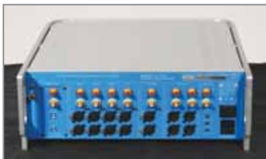
Un pannello connessioni di livello fantascientifico.