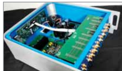
Ordine, razionalità e componenti di grande caratura il segreto del Tautoro?

un autorevole esponente di quella categoria di oggetti che rifugge da qualsiasi artificio, più o meno piacevole, per rendere il suono, anche solo un pochino, più accattivante.